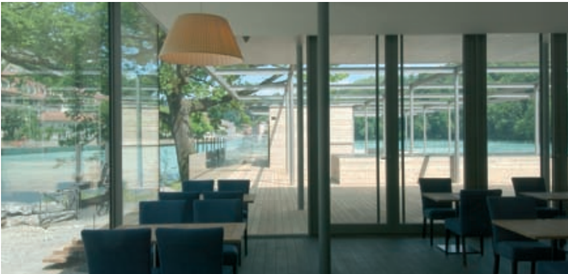
Das Ambiente im Innern des «Schwellenmätteli» strömt Ruhe aus.