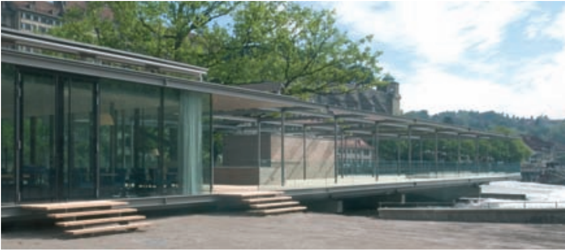
Die Konstruktion des Glaspavillons orientiert sich an der Bauweise der Schwellenanlagen: Fundamente in Beton, tragende Teile in Stahl, Böden und Dächer in Holz.