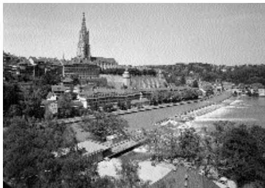
Das Schwellenmätteli mit Berner Münster im Hintergrund.

Bereits 1989 bis 1995 waren im Auftrag der Stadt Projektstudien zur Erneuerung des Restaurants in Auftrag gegeben worden. Es fehlte jedoch ein zusammenhängendes, gastroorientiertes Nutzungskonzept.