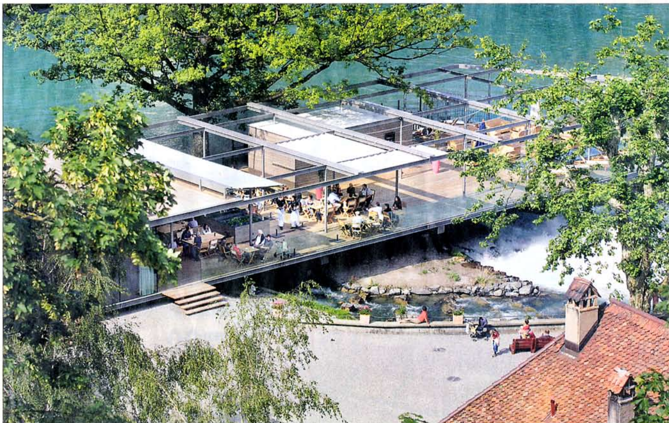
Nach fünfzehn Jahren Planung und zehn Monaten Bauzeit vollendet: Das Schwellenmätteli an der Berner Aare

Schlemmen mitten im Fluss unter freiem Himmel: Das Schwellenmätteli an der Aare in Bern