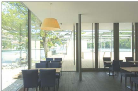
Terrasse: Restaurant, Bar und Loungebetrieb mit 160 Sitzen