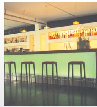
Ideal für Ihren Event, die Lounge

Ristorante mit eigener Kücheninfrastruktur und Cheminée bietet 80 Gästen Platz und wird als eigenständiges Restaurant mit italienischen Spezialitäten betrieben.