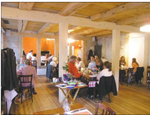
Casa, gemütliches Ambiente mit Cheminée.