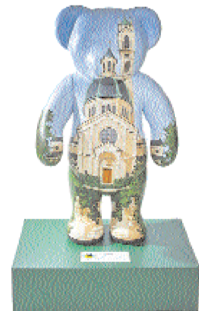
■ Bär sucht neues Heim. Einer der 159 Teddys, der zu ersteigern ist.

In drei bis vier Jahren kommt eine neue Aktion, «etwas ganz anderes», ver-