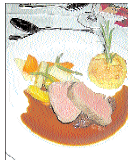
■ Der Hauptgang. Rindsfilettranchen, Kartoffelgratin, Gemüse.